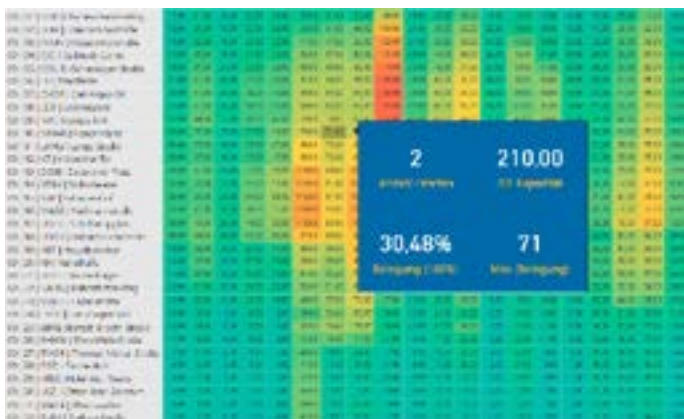
Ein- und Ausstiegsdaten in einer Wärmebildsimulation mit anonymisierten Haltepunkten

Auf Grundlage der Ein- und Ausstiegsdaten der Fahrgäste wurde zunächst ein Wärmebild simuliert, welches der Nutzer auf verschiedene Zeiträume aggregieren kann. Mit dieser Simulation sind die Auslastungen mit einem beliebigem Zeitfilter, sogar minütlich - speziell nach Fahrplan, einsehbar. Zudem erlaubt ein weiteres Feature die Wärmebildanpassung auf Basis eines individuell vorgegebenen Richtwertes der prozentualen Auslastung, sodass eine erste Simulation von anderen Fahrzeugkapazitäten stattfinden kann.